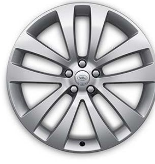
23" S 5 ZDVOJENÝMI LÚČMI, VZOR 5135 3 , LESKLÉ STRIEBORNÉ