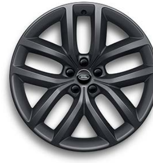
22" S 5 ZDVOJENÝMI LÚČMI, VZOR 5127 1 , MATNÉ TMAVOSIVÉ Štandardná výbava pre Dynamic HSE