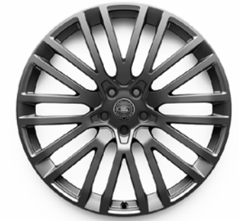
23" S 10 ZDVOJENÝMI LÚČMI, VZOR 1084 2 , LEŠTENÉ TMAVOSIVÉ, KOVANÉ Štandardná výbava pre Edition Two