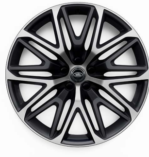
22" S 10 ZDVOJENÝMI LÚČMI, VZOR 1083 2 , MATNÉ TMAVOSIVÉ S KONTRASTNÝMI PLOCHAMI OPRACOVANÝMI DIAMANTOVÝM SÚSTRUŽENÍM