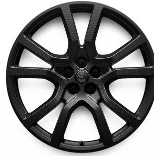
23" Z UHLÍKOVÝCH VLÁKIEN S 5 ZDVOJENÝMI LÚČMI, VZOR 5132 2 , MATNÉ SIVÉ