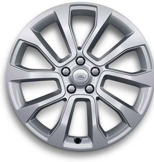
21" S 5 ZDVOJENÝMI LÚČMI, VZOR 5126 1 , LESKLÉ STRIEBORNÉ Štandardná výbava pre SE