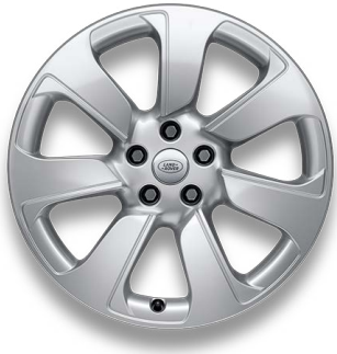
20" S O 7 LÚČMI, VZOR 7020 1 , LESKLÉ STRIEBORNÉ Štandardná výbava pre S