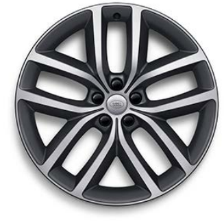
22" S 5 ZDVOJENÝMI LÚČMI, VZOR 5127 1 , MATNÉ TMAVOSIVÉ S KONTRASTNÝMI PLOCHAMI OPRACOVANÝMI DIAMANTOVÝM SÚSTRUŽENÍM Štandardná výbava pre Autobiography