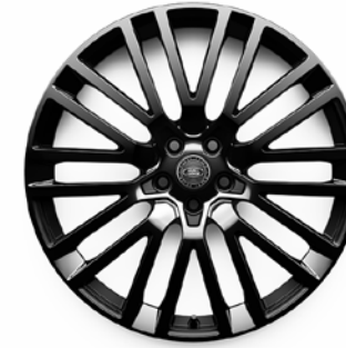
23" S 10 ZDVOJENÝMI LÚČMI, VZOR 1084 2 , DUO TONE MATNÉ/LESKLÉ ČIERNE, KOVANÉ