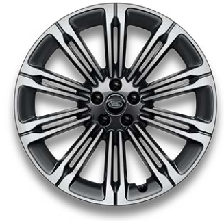
23" S 10 ZDVOJENÝMI LÚČMI, VZOR 1075 1 , LESKLÉ TMAVOSIVÉ S KONTRASTNÝMI PLOCHAMI OPRACOVANÝMI DIAMANTOVÝM SÚSTRUŽENÍM