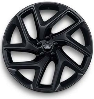
22" S 5 ZDVOJENÝMI LÚČMI, VZOR 5131 1 , MATNÉ ČIERNE S LESKLÝMI ČIERNYMI KONTRASTNÝMI PLOCHAMI