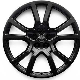
23" Z UHLÍKOVÝCH VLÁKIEN S 5 ZDVOJENÝMI LÚČMI, VZOR 5132 2 , LESKLÉ TMAVÉ