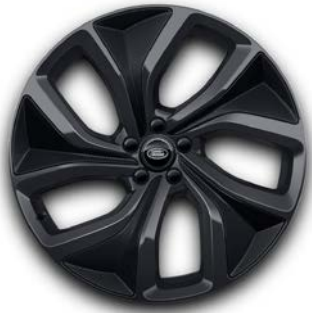
23" S 5 ZDVOJENÝMI LÚČMI, VZOR 5128 1 , TMAVOSIVÉ S INTARZIAMI Z UHLÍKOVÝCH VLÁKIEN