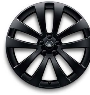
23" S 5 ZDVOJENÝMI LÚČMI, VZOR 5135,35 2 , LESKLÉ ČIERNE