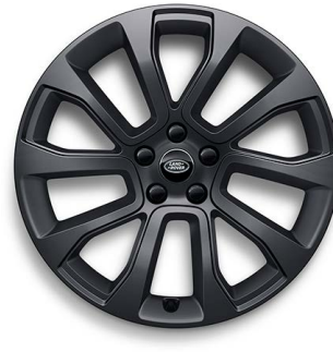
21" S 5 ZDVOJENÝMI LÚČMI, VZOR 5126 1 , MATNÉ TMAVOSIVÉ Štandardná výbava pre Dynamic SE