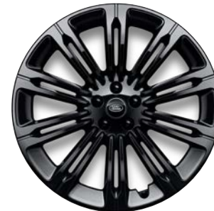
22" S 10 ZDVOJENÝMI LÚČMI, VZOR 1075 6,7 , LESKLÉ ČIERNE