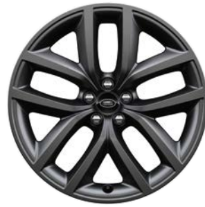
20" S 10 LÚČMI, VZOR 1089 2 , MATNÉ TMAVOSIVÉ