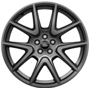
21" S 5 ZDVOJENÝMI LÚČMI, VZOR 5109 5,6 , MATNÉ TMAVOSIVÉ