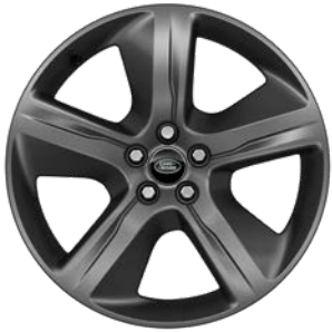
19" S 5 LÚČMI, VZOR 5108 1 , MATNÉ TMAVOSIVÉ Štandardná výbava pre S