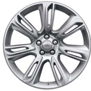
20" S 7 ZDVOJENÝMI LÚČMI, VZOR 7014 2 , STRIEBORNÉ