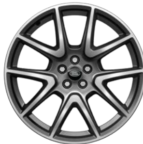
21" S 5 ZDVOJENÝMI LÚČMI, VZOR 5109 5,6 , MATNÉ TMAVOSIVÉ S KONTRASTNÝMI PLOCHAMI OPRACOVANÝMI DIAMANTOVÝM SÚSTRUŽENÍM Štandardná výbava pre Autobiography