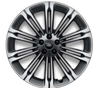
22" S 10 ZDVOJENÝMI LÚČMI, VZOR 1075 4,7 , LESKLÉ TMAVOSIVÉ S KONTRASTNÝMI PLOCHAMI OPRACOVANÝMI DIAMANTOVÝM SÚSTRUŽENÍM