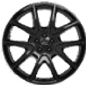
21" S 5 ZDVOJENÝMI LÚČMI, VZOR 5109 5,6 , LESKLÉ ČIERNE Štandardná výbava pre Belgravia Edition Satin P400e AWD