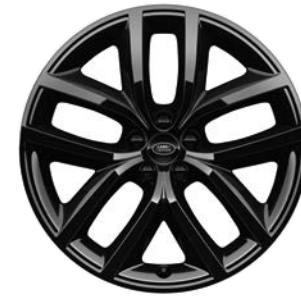
20" S 10 LÚČMI, VZOR 1089 2,3 , LESKLÉ ČIERNE